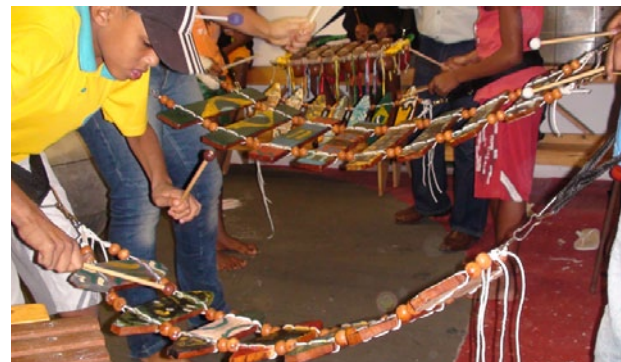
Humarimbas produzidas no projeto Construindo o Som